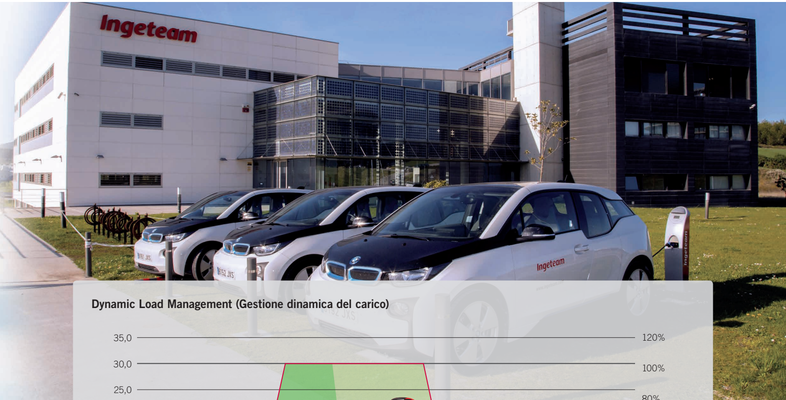
Dynamic Load Management (Gestione dinamica del carico)