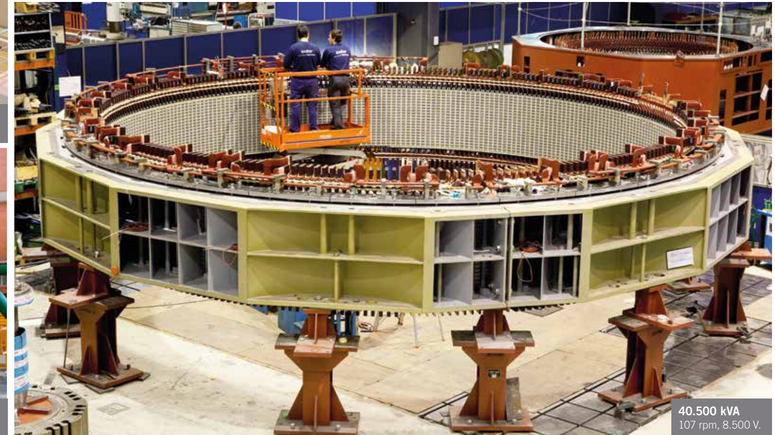
40.500 kVA 107 rpm, 8.500 V.