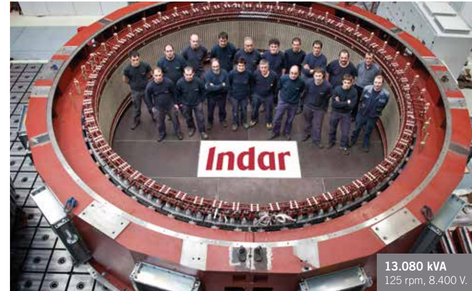
13.080 kVA 125 rpm, 8.400 V.