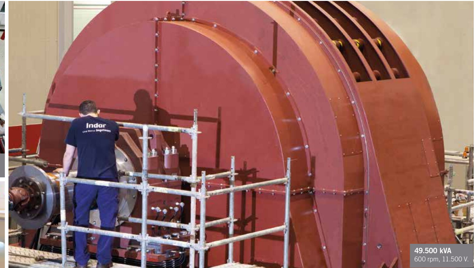
49.500 kVA 600 rpm, 11.500 V.