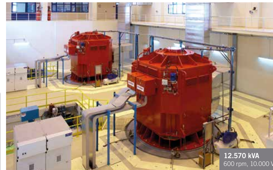
12.570 kVA 600 rpm, 10.000 V.