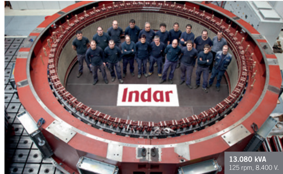
13.080 kVA 125 rpm, 8.400 V.