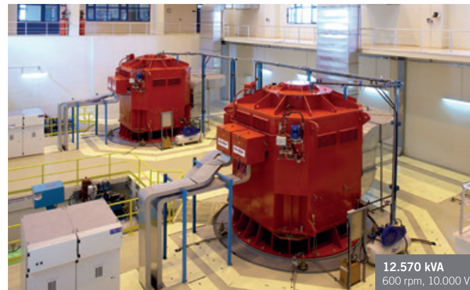
12.570 kVA 600 rpm, 10.000 V.