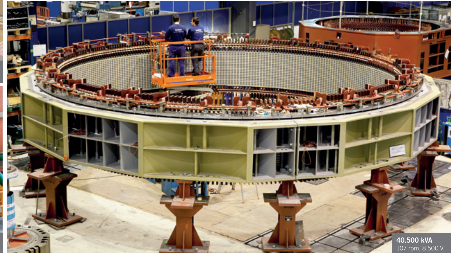
40.500 kVA 107 rpm, 8.500 V.