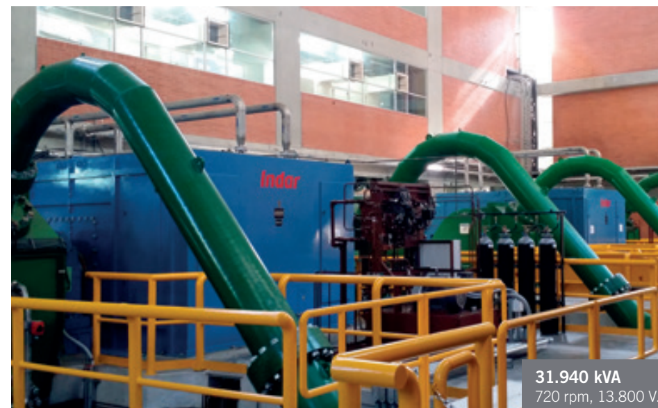
31.940 kVA 720 rpm, 13.800 V.