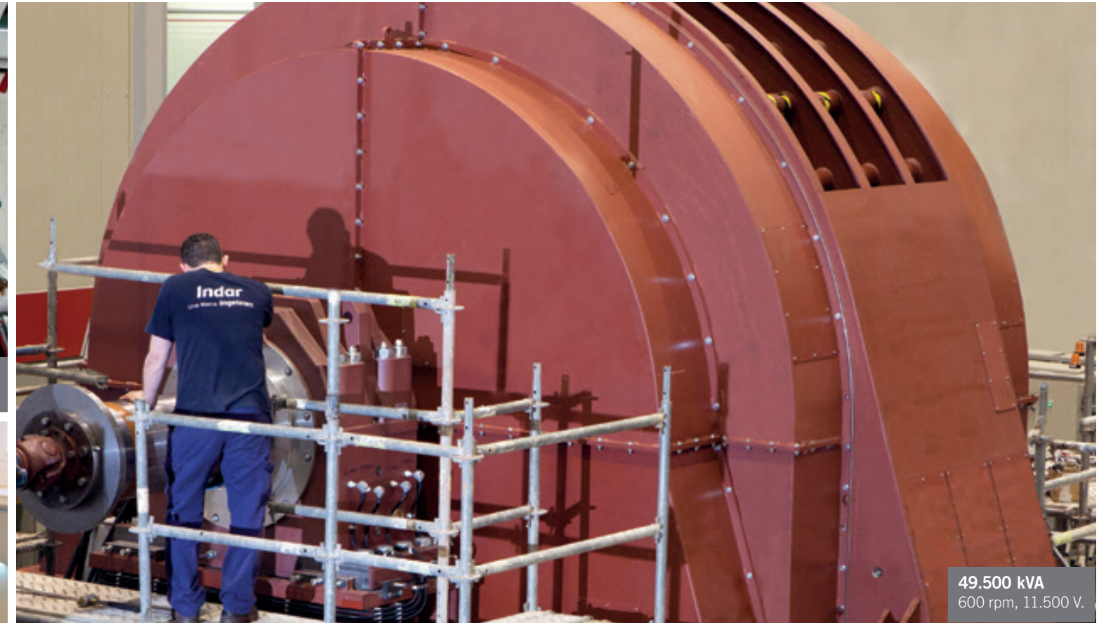
49.500 kVA 600 rpm, 11.500 V.